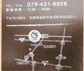
宝殿駅から歩いて行ける距離。 お店の前に駐車場もあります。 ほっともとの北側。 米田の方なら歩いて飲みに行けますね

宝殿駅南口をまっすぐ南に下り、向かいます。向かいのビルに「トコトコ」の看板があります。お電話でもご予約いただけます。お電話は079-431-8858です。お電話の際は「トコトコ」の看板を見つけてください。