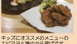
キッズにオススメのメニューの エビマヨと鶏のから揚げです。