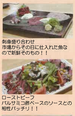
刺身盛り合わせ 市場からその日に仕入れた魚なので新鮮そのもの！！

お電話でもご予約いただけます。お電話は079-431-8858です。お電話の際は「トコトコ」の看板を見つけてください。